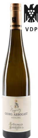
2020er Riesling "Georg Abogast" GG Franckenstein, Ortenau DE

Der Neugesetz "Georg Arbogast" Riesling ist ein erstklassiger Wein mit feingliedrigen gelb fleischigen Aromen, die sich im Geruch entfalten. Dieser mineralische Riesling besticht mit Noten von Brennesseln, Mango, Maracuja und einer subtilen Zitrusfrische. Am Gaumen überzeugt er mit einem aromatischen Ausdruck und einem kräftigen Finish. Der Nachgang ist geprägt von Kraft, Länge und einer Vielschichtigkeit, die diesen Riesling zu einem besonderen Genuss machen.