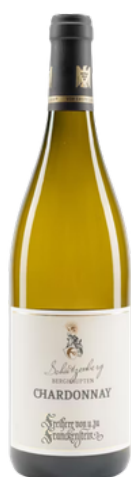
2022er Chardonnay Schützenberg 1. Lage Franckenstein, Ortenau Baden

Zart floraler und ganz leicht pflanzlicher Duft mit hellen gelbfruchtigen Noten. Hell-nussig, etwas hefig und floral im Mund, leicht schmelzige, wiederum helle Frucht, sehr feine Säure, gewisse Nachhaltigkeit, ein wenig Vanille und Butter am Gaumen, mineralische Spuren