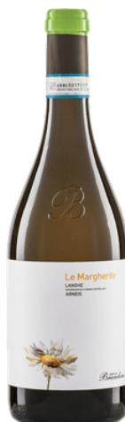
2024er Arneis Langhe DOC Bio Brandini, Piemont IT

Feinfruchtige Nase mit Nuancen von weißen Blüten und Zitrone. Am Gaumen mineralisch mit fein dosierter Säure und einer ganz feinen, sortentypischen Bitternote, animierend, ausgewogen und sehr lebendig. Ein Arneis, der selbst abgebrühte Fans der Sorte staunen lässt.